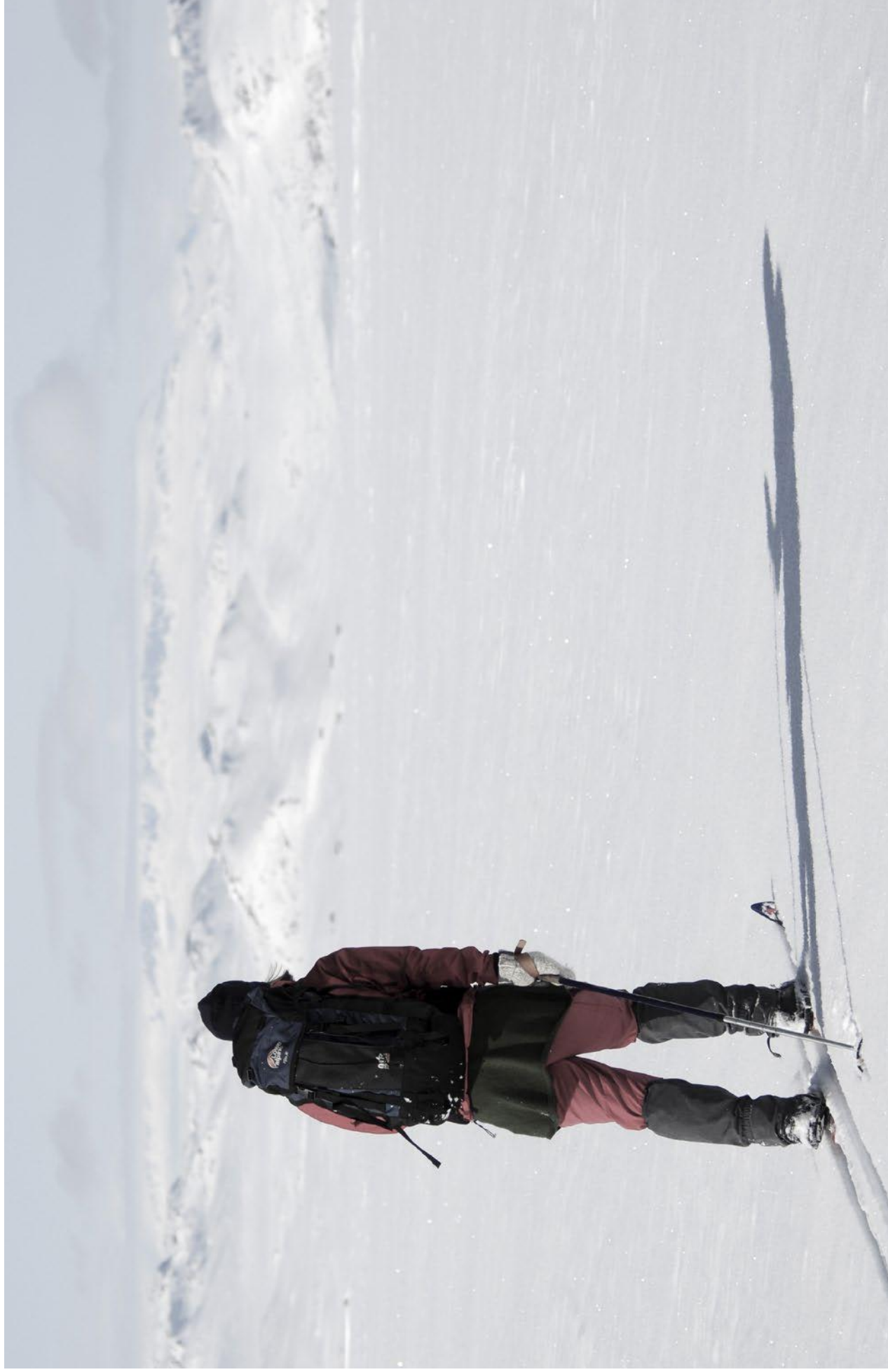
Opplevelsen av stilhet og ro når man ferdes i naturen er viktig for mange. Regelverket som regulerer motorferdsel i utmark og vassdrag har som formål å ivareta blant annet disse hensynene.

Det er vikt natur, som mest særpr Norge.