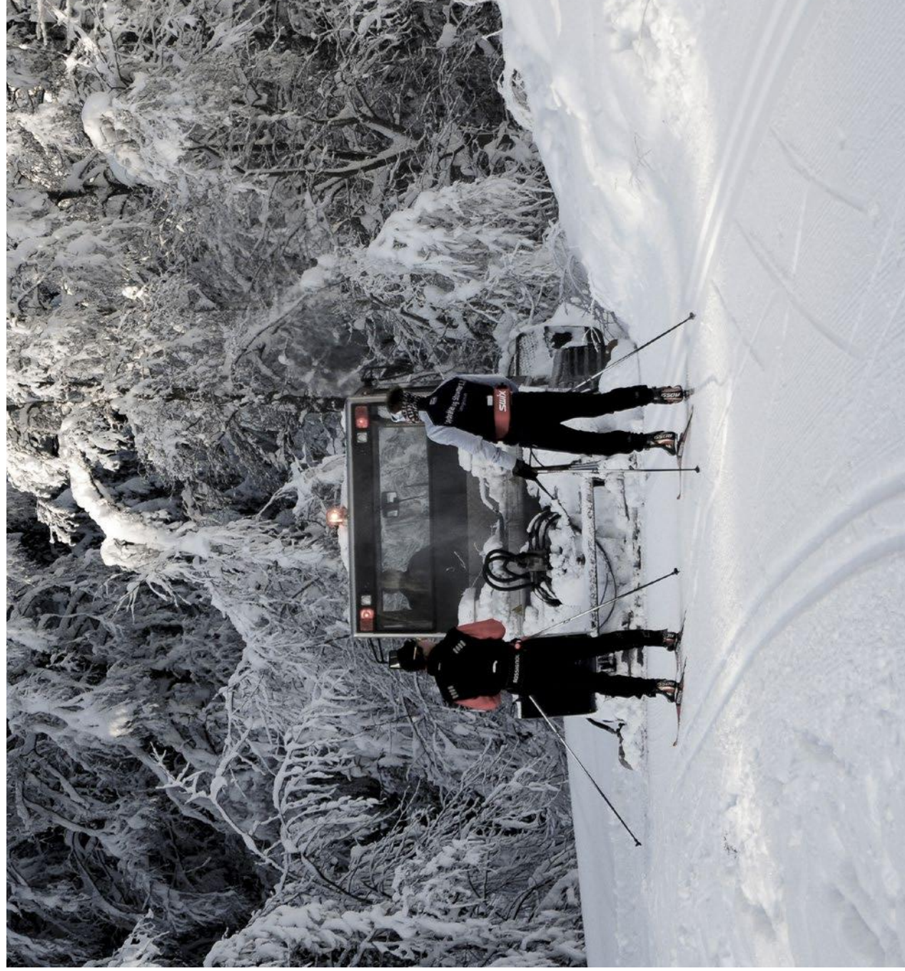
Motorkjøretøy på vinterføre kan nyttes til opparbeiding og preparering av skiløyper og skibakker for allmennheten og for konkurranser, når det foretas av kommuner, hjelpekorps, idrettslag, turlag eller turistbedrifter.