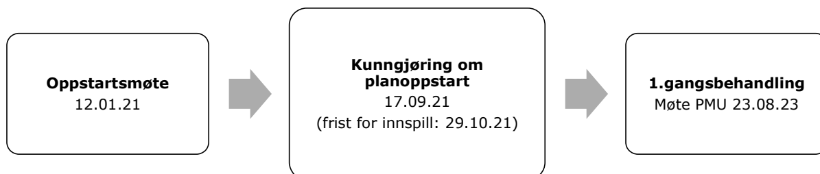
Figur 2. Planprosessen

Oppstartsmøte fant sted 12. januar 2021. Planoppstart ble kunngjort 17. september 2021 i avisa Sør-Trøndelag og på kommunens nettsider. Varsling av berørte grunneiere, offentlige myndigheter og andre ble varslet per brev datert 5. oktober 21.