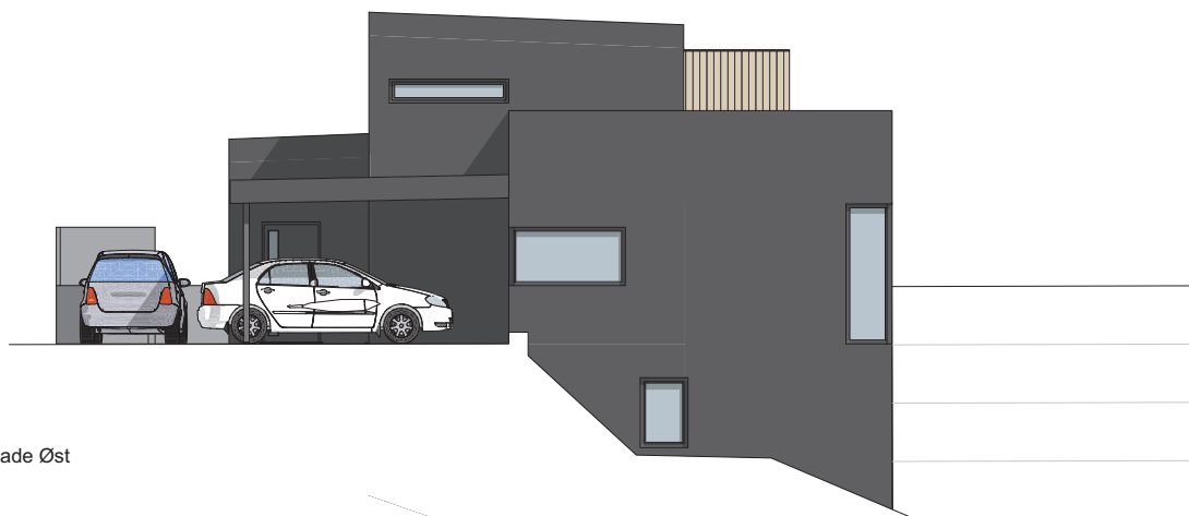
1:100 Fasade Øst