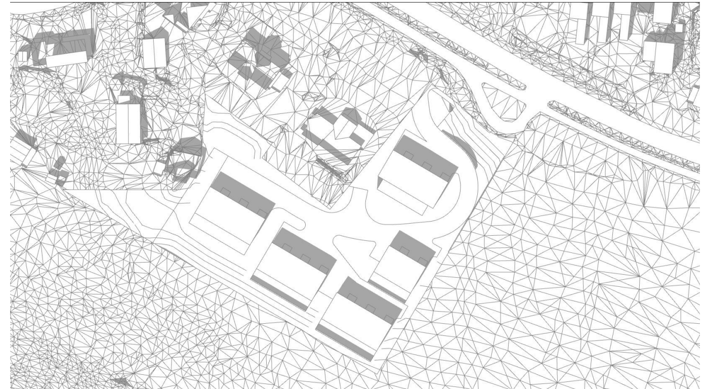
21 juni kl1300