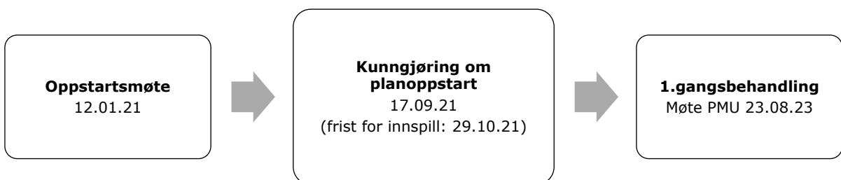
Figur 2. Planprosessen

Oppstartsmøte fant sted 12. januar 2021. Planoppstart ble kunngjort 17. september 2021 i avisa Sør-Trøndelag og på kommunens nettsider. Varsling av berørte grunneiere, offentlige myndigheter og andre ble varslet per brev datert 5. oktober 21.